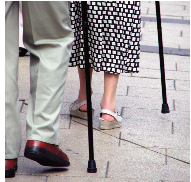
SAFEHIP® er den bedst klinisk testede hoftebeskytter i verden. Samtlige studier findes på www.nordicare.se

Hoftebrud kan forebygges. For personer, som er tilbøjelige til at falde, er det ligeså vigtigt at anvende SAFEHIP® hoftebeskyttere som at bruge sikkerhedssele i bilen.